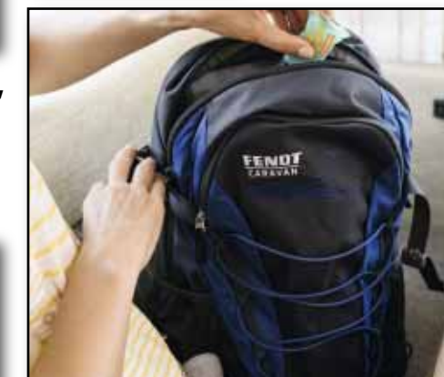
Rucksack, Artikel-Nr.: 2410 von Deuter Farbe: graphite-steel; 46 x 30 x 19 cm; Airstripes Rückensystem; anatomisch geformte und gepolsterte Schulterträger; bequemer Zugang zum Hauptfach; Vortasche mit zwei Netztaschen und Schlüsselhalter; Nasswäschefach; reflektierende Blinklichthalterung; stufenlos verstellbarer Brustgurt; Netzhüftlossen, Kompressionsriemen; Wanderstockhalterung, Euro 56,00