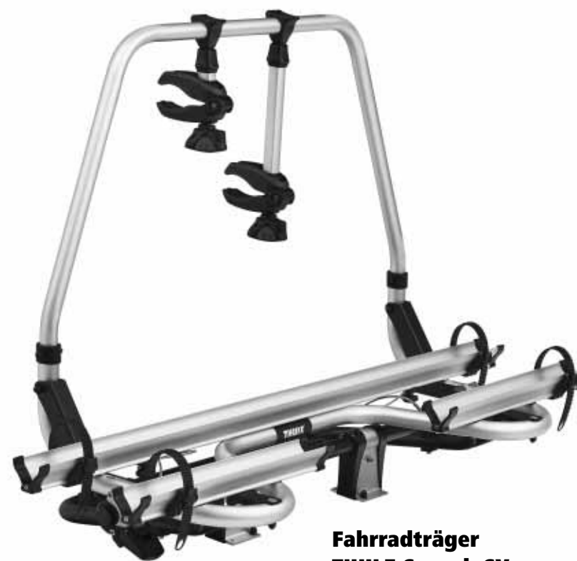
Fahrradträger THULE Superb SV