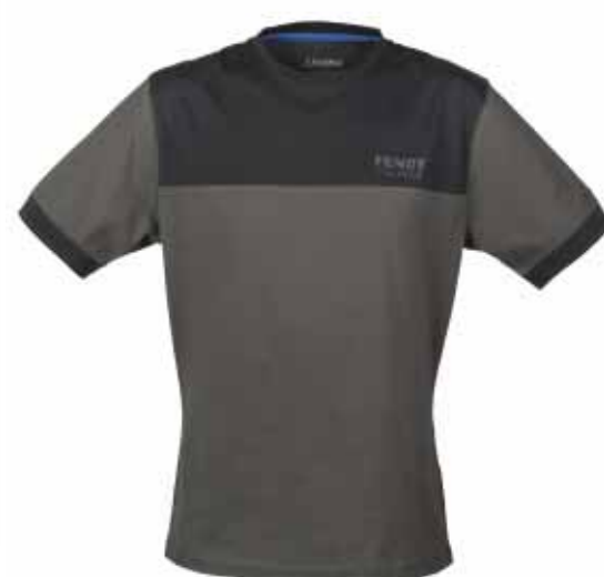
T-Shirt, von Schöffel, Größe/Artikel-Nr.: Herren - Größe 58: 9030; Größe 60: 9035; Größe 62: 9040; Größe 64: 9045; Größe 66: 9050; Größe 68: 9055; Größe 70: 9060; Größe 72: 9065; Größe 74: 9070; Größe 76: 9075; Größe 78: 9080; Größe 80: 9085; Größe 82: 9090; Größe 84: 9095; Größe 86: 9100; Größe 88: 9105; Größe 90: 9110; Damen - Größe 36: 9060; Größe 38: 9065; Größe 40: 9070; Größe 42: 9075; Größe 44: 9080; Größe 46: 9085; Größe 48: 9090; Größe 50: 9095; Größe 52: 9099; Größe 54: 9104; Größe 56: 9109; Größe 58: 9114; 100% Bio-Baumwolle, hoher Tragekomfort, Euro 21,90