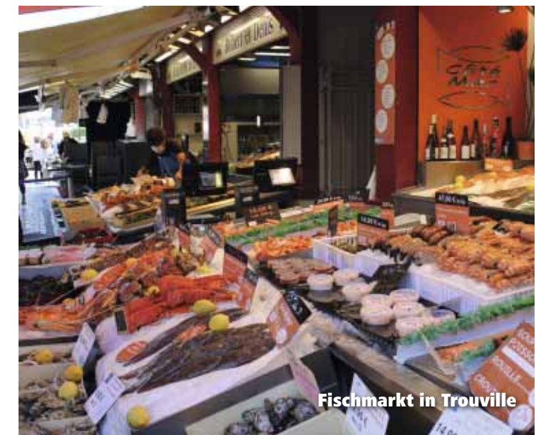
Fischmarkt in Trouville