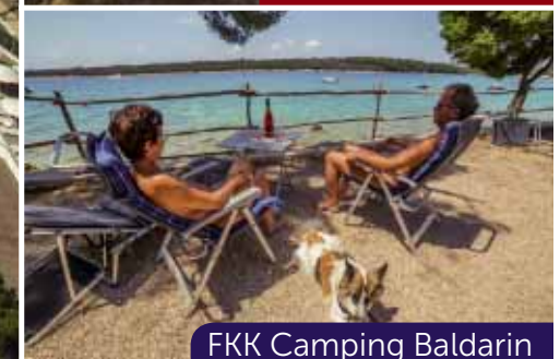
FKK Camping Baldarin