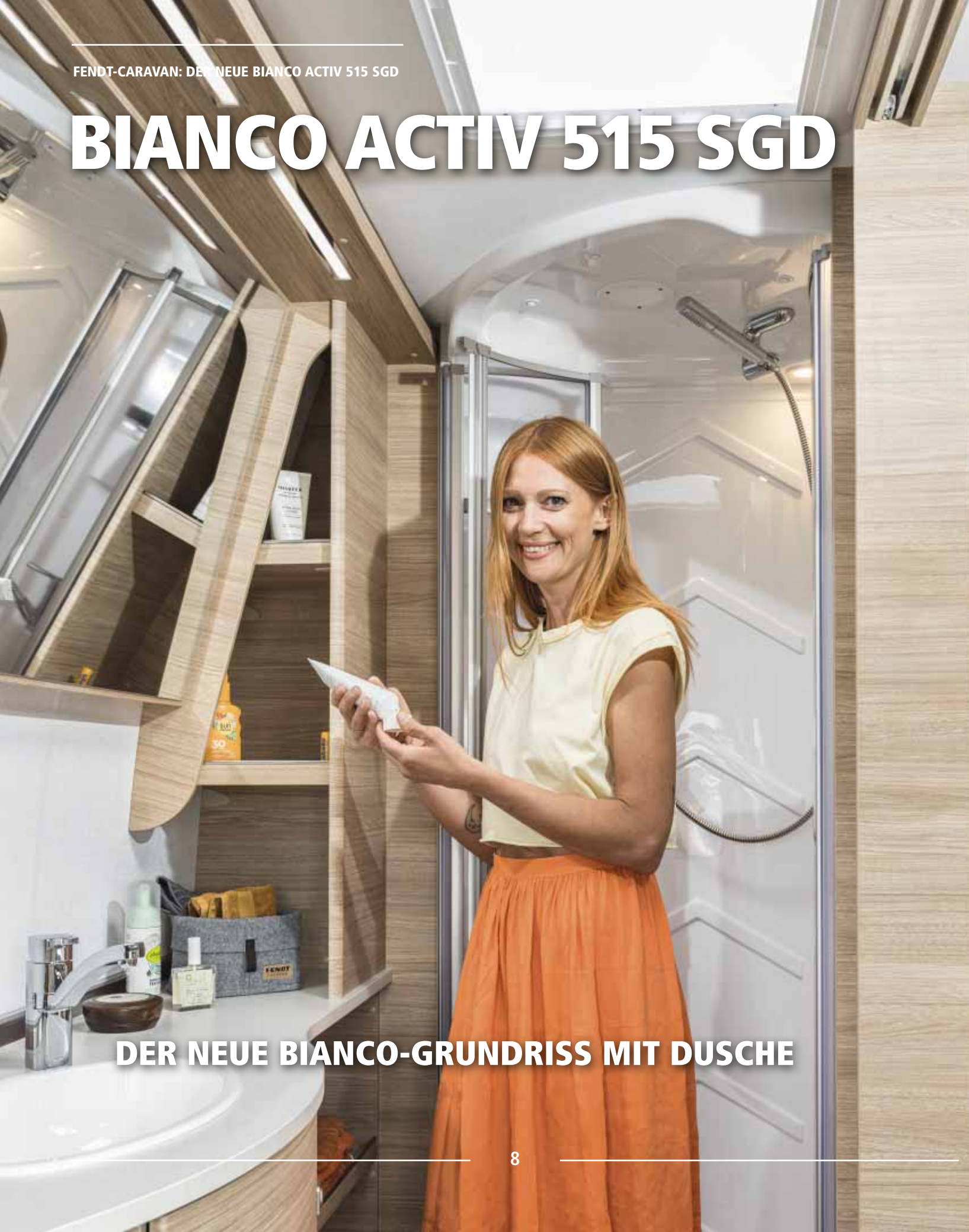
DER NEUE BIANCO-GRUNDRISS MIT DUSCHE