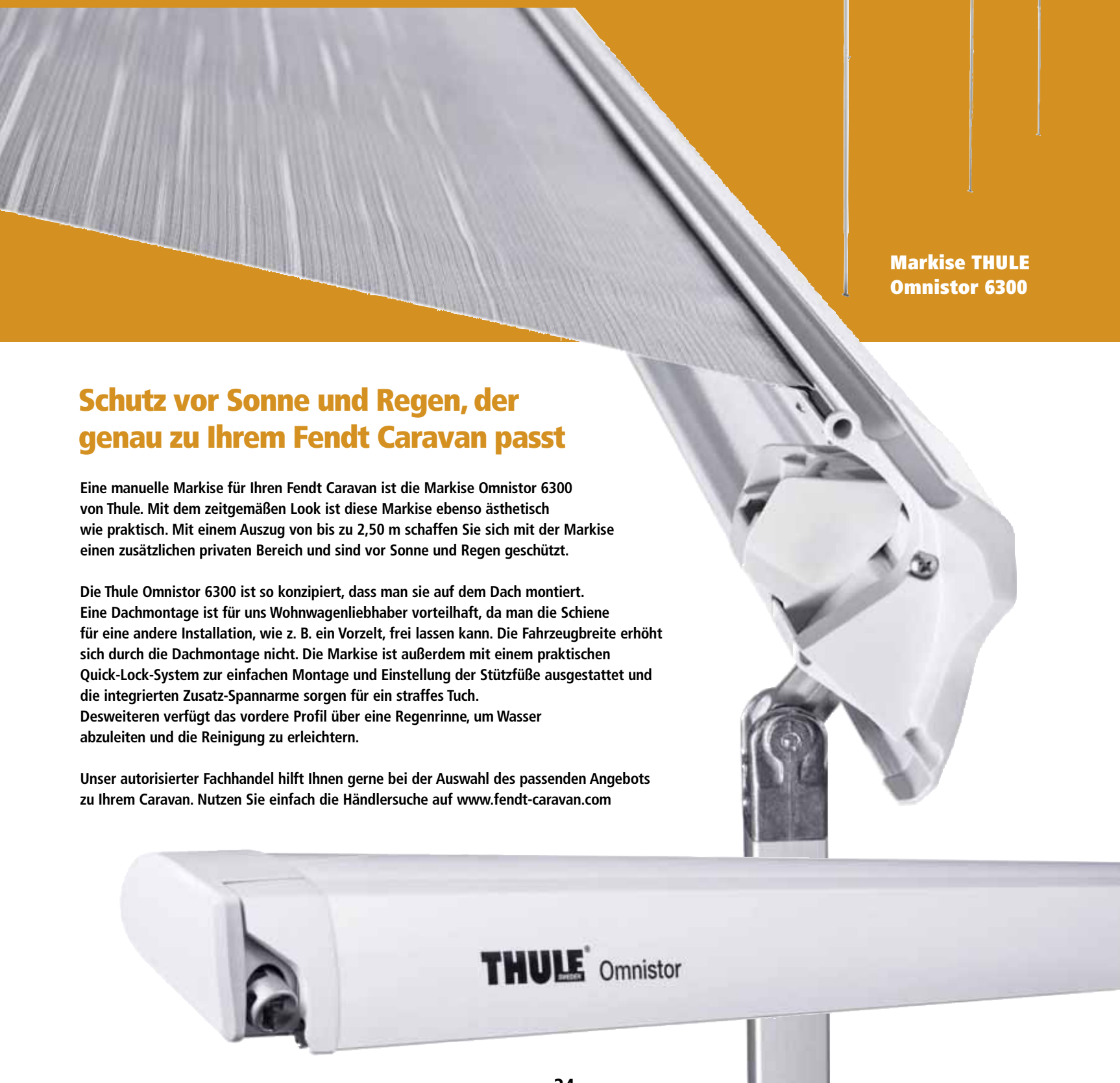
Markise THULE Omnistor 6300