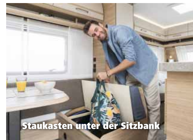
Staukasten unter der Sitzbank