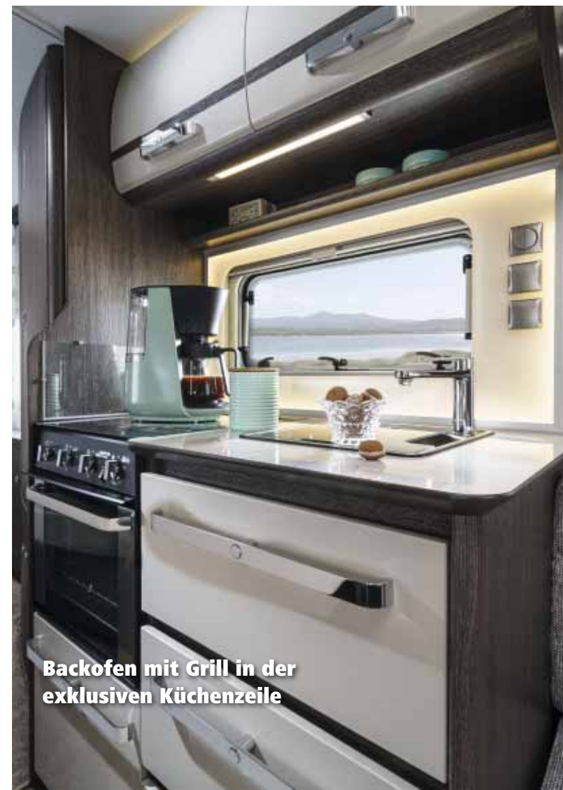
Backofen mit Grill in der exklusiven Küchenzeile

Weitere Besonderheiten in der Serienausstattung des Diamant sind auch die Panorama-Dachhaube „Skylight“ sowie der praktische Backofen mit Grill. Die edlen Stoffe „Faro“, „Salina“ oder die Echtleder-Sonderausstattung „Zingst“ sowie das Möbeldekor „Rovero-Castello“ betonen die besondere Stellung des Diamant innerhalb der Fendt-Caravan-Baureihen.