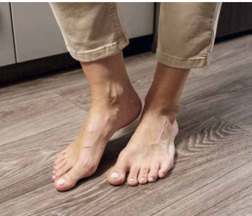
Wohltuende Wärme durch die Warmwasser-Heizung und Warmwasser-Fußbodenerwärmung