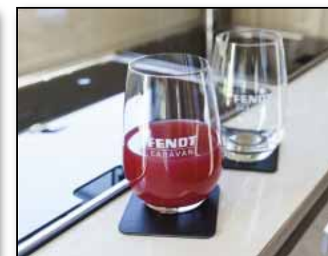
Silwy Magnet-Kristallgläser-Set, Artikel-Nr.: 2060, zwei formschöne Longdrinkgläser im Set mit integrierten Magneten in den Böden, ver- edelt mit Fendt-Caravan-Gravur, fester Halt durch zwei Metall-Nano-Gel-Pads black, Euro 44,95