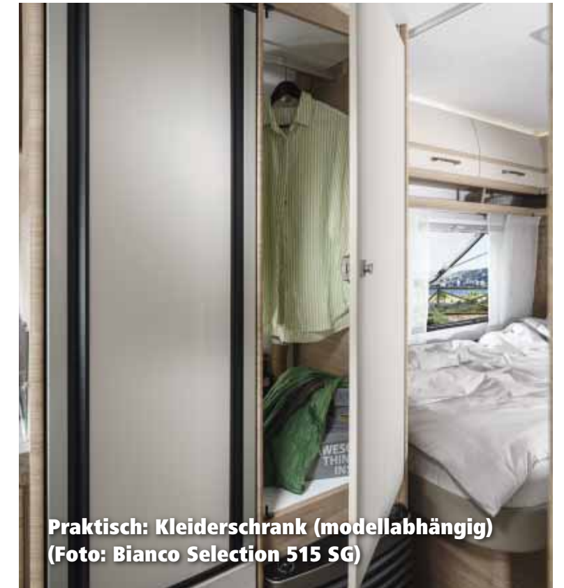
Praktisch: Kleiderschrank (modellabhängig) (Foto: Bianco Selection 515 SG)

Der neueste Grundriss Bianco Activ 515 SGD ergänzt das umfangreiche Angebot um einen Wohnwagen mit Heckbad und Dusche sowie einem großen Platzangebot und getrennten Betten. Wir stellen Ihnen deshalb diesen Grundriss auf den nächsten Seiten im Detail vor.