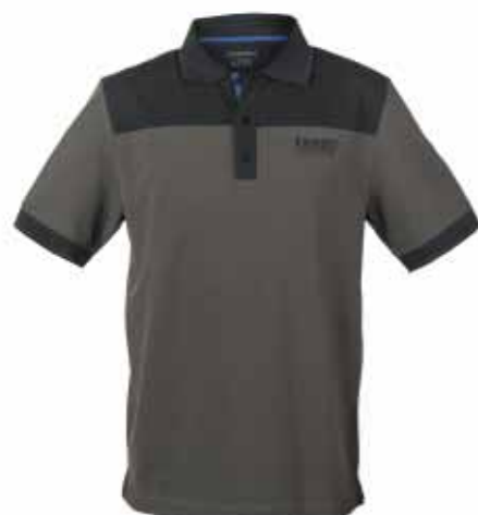
Poloshirt, von Schöffel Größe/Artikel-Nr.: Herren - Größe 48: 9105; Größe 50: 9110; Größe 52: 9115; Größe 54: 9120; Größe 56: 9125; Größe 58: 9130; Größe 60: 9135; Größe 62: 9140; Größe 64: 9145; Größe 66: 9150; Größe 68: 9155; Größe 70: 9160; Größe 72: 9165; Größe 74: 9170; Größe 76: 9175; Größe 78: 9180; Größe 80: 9185; Größe 82: 9190; Größe 84: 9195; Größe 86: 9200; Größe 88: 9205; Größe 90: 9210; Poloshirt für den täglichen Einsatz. Hohe Bewegungsfreiheit durch 2-Wege-Stretch-Material, Euro 37,90