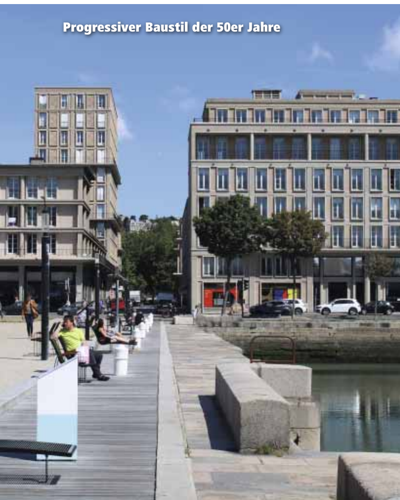
Progressiver Baustil der 50er Jahre