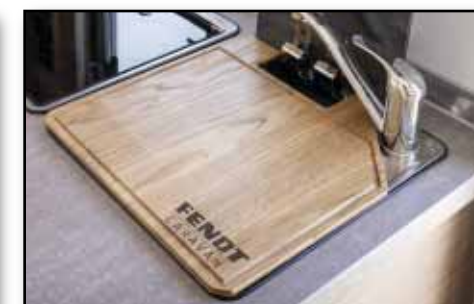
Abdeckbrett, Variante SCHRÄG Artikel-Nr.: 2080, Brett für die perfekte Platzierung über dem Waschbecken, aus Eiche, geölt, mit umliegen- der Saftrille, Maße: ca. 36x35 cm, Euro 119,00