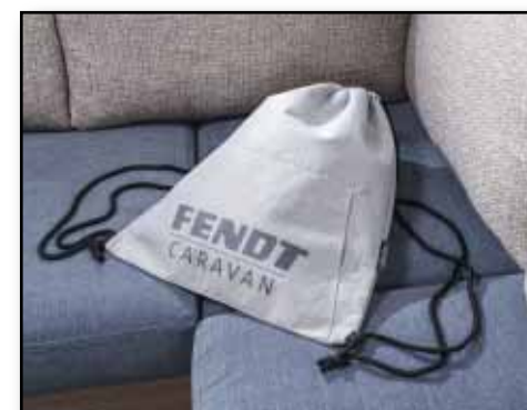
Sportbeutel „Hoodie“, Artikel-Nr.: 7070 Hauptfach mit Kordelverschluss, mit Vortasche, Volumen: ca. 5 Liter; Maße H/B ca. 47 x 40 cm; Gewicht: ca. 160 g; Material: 240 g/m 2 Jersey Polyester, Euro 12,90