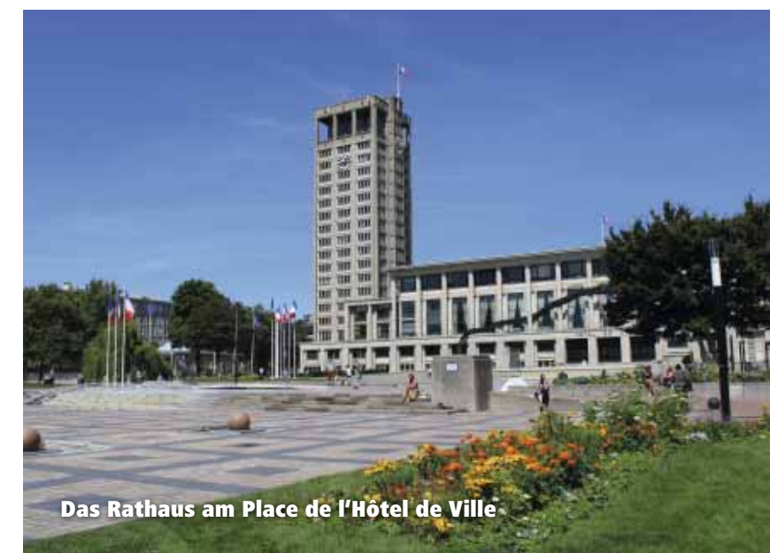
Das Rathaus am Place de l’Hôtel de Ville

Viele interessante Informationen: www.lehavre-etretat-tourisme.com/de/