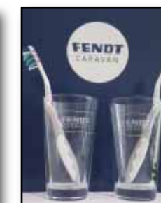
Zahnputzglas-Set, (2 Stück) von Mahlwerck Artikel-Nr.: 6750 Durchmesser: ca. 75 mm; Höhe: ca. 127 mm; ideal für die Halterung im Fendt Caravan geeignet, Euro 21,90