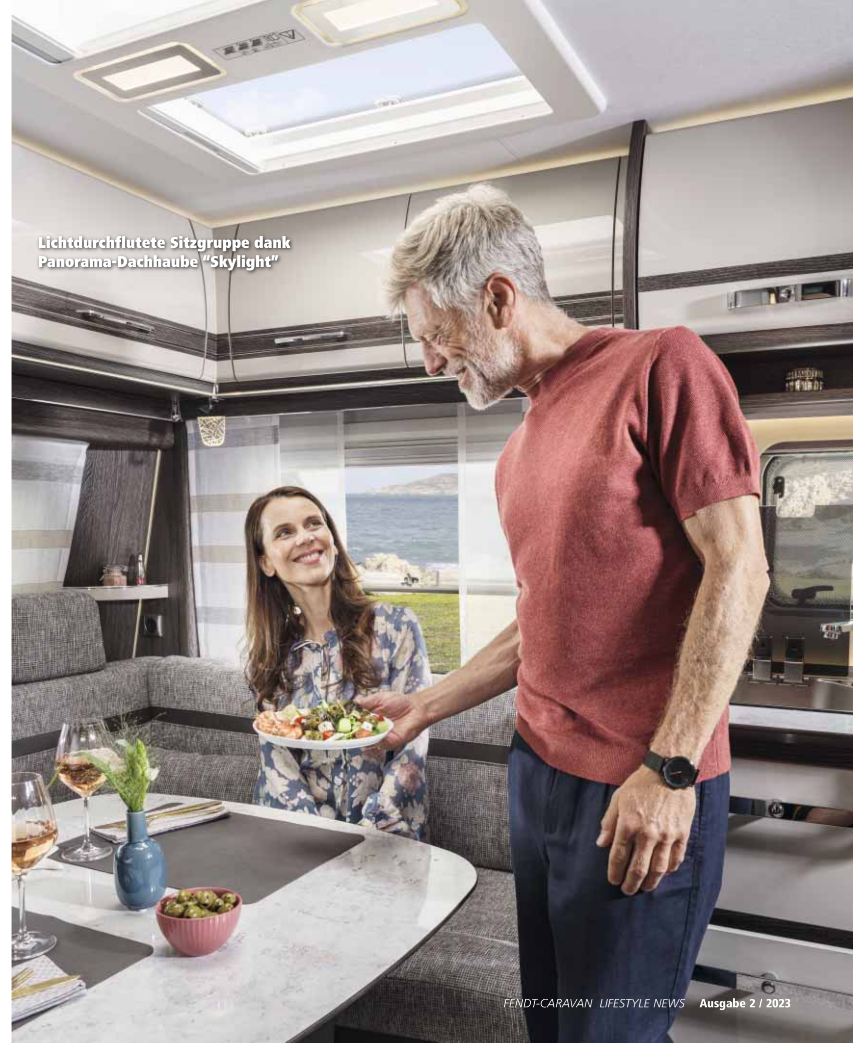
Lichtdurchflutete Sitzgruppe dank Panorama-Dachhaube „Skylight“