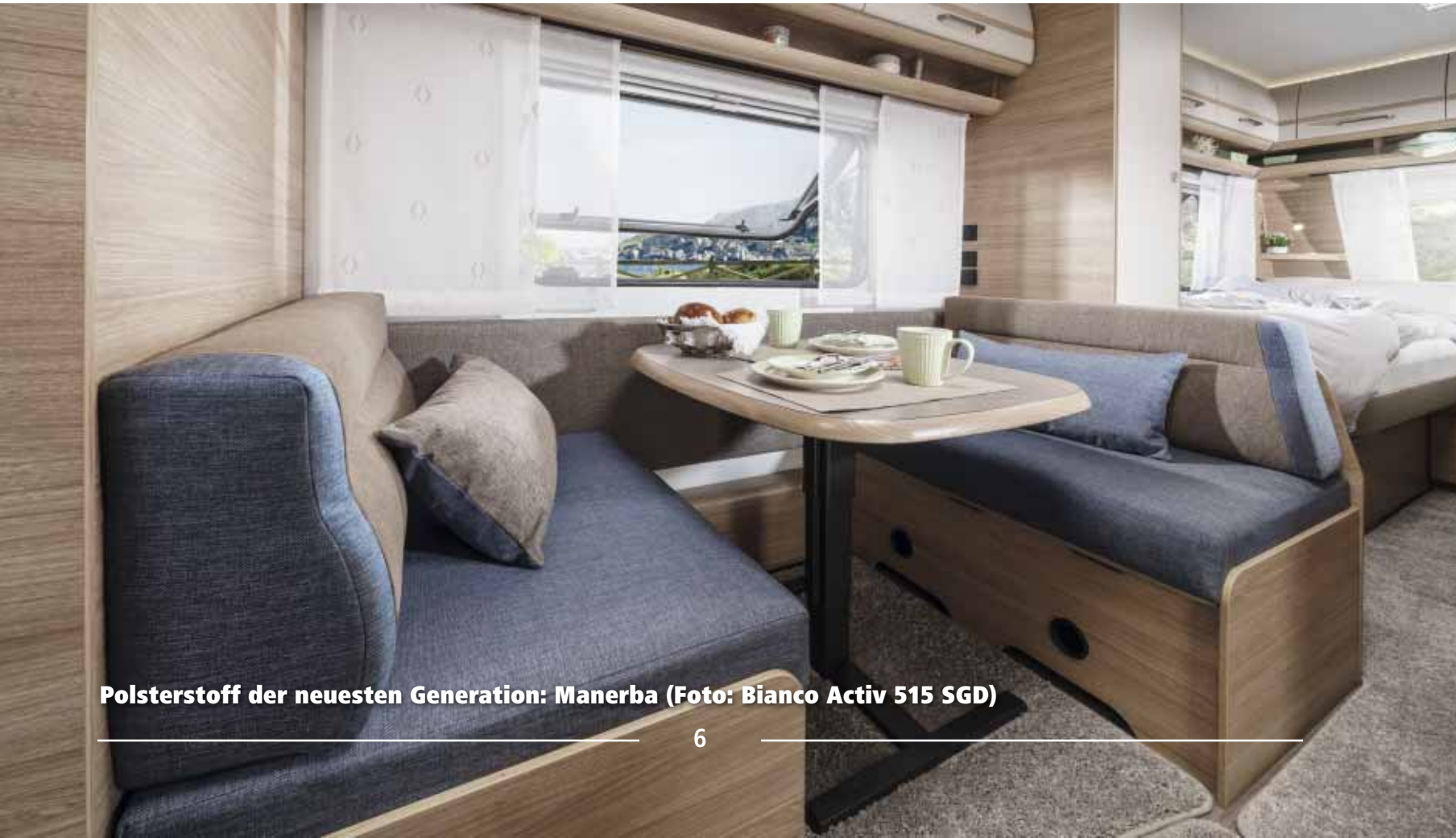
Polsterstoff der neuesten Generation: Manerba (Foto: Bianco Activ 515 SGD)