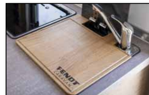
Abdeckbrett, Variante GERADE Artikel-Nr.: 2070, Brett für die perfekte Platzierung über dem Waschbecken, aus Eiche, geölt, mit umliegen- der Saftrille, Maße: ca. 36x35 cm, Euro 119,00