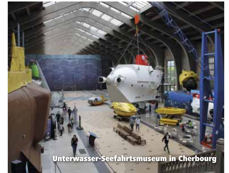
Unterwasser-Seefahrtsmuseum in Cherbourg