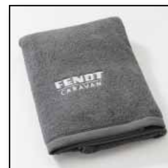
Walk-Frottier-Duschtuch, von Erwin Müller, Artikel-Nr.: anthrazit: 9940 ; weiß: 9930, 70 x 140 cm, 100% Baumwolle, Euro 25,95