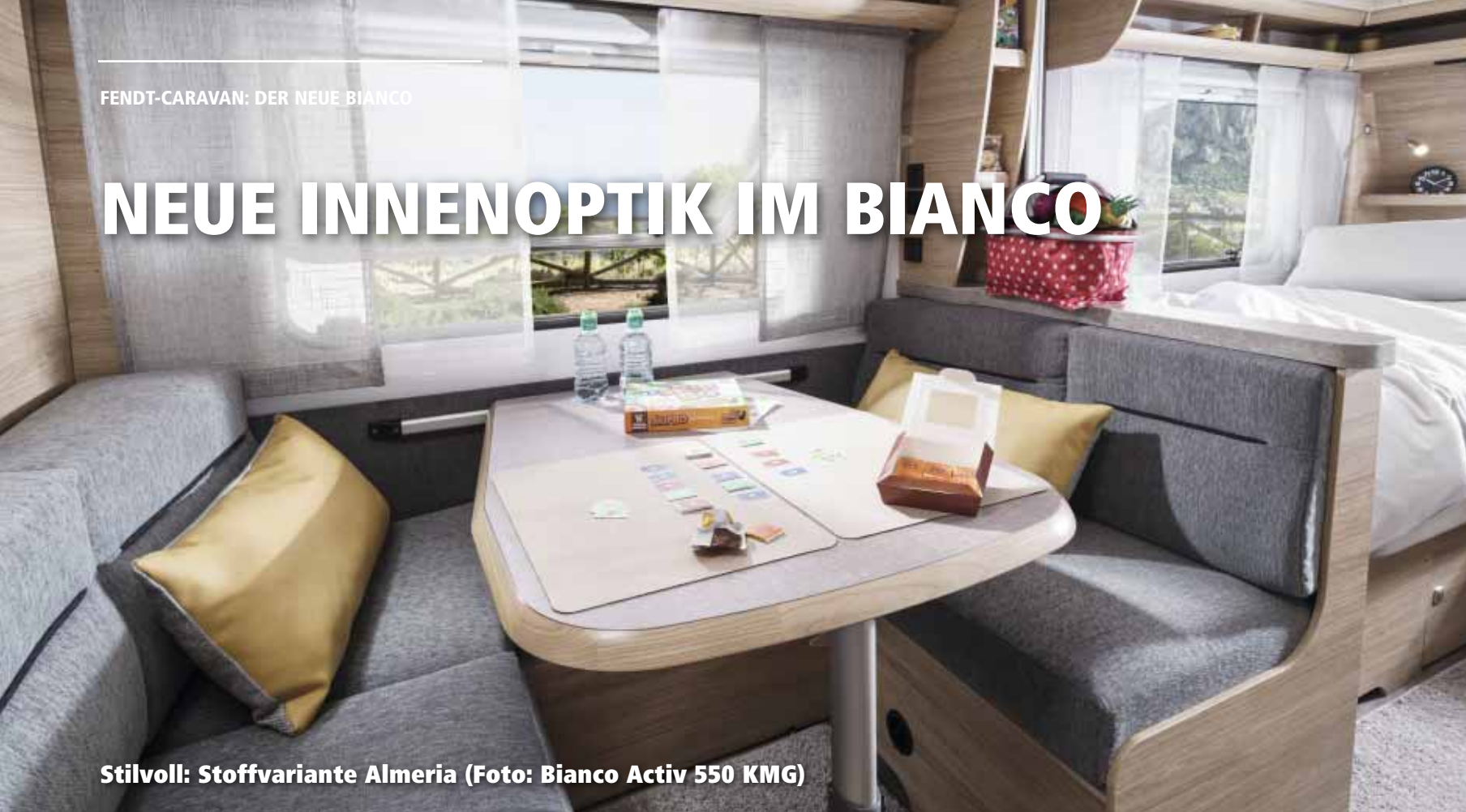
Stilvoll: Stoffvariante Almeria