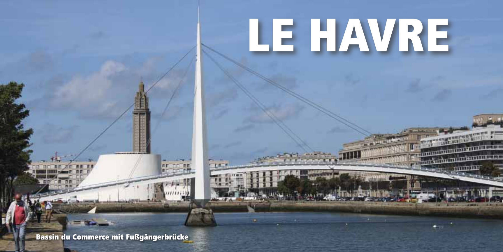
Bassin du Commerce mit Fußgängerbrücke