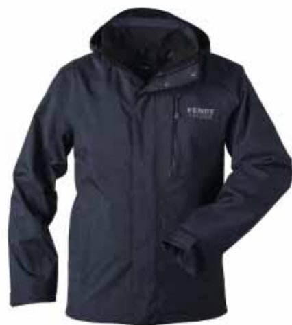
Pro-Business-Jacke, von Schöffel Größe/Artikel-Nr.: Herren - Größe 50: 9410; Größe 52: 9415; Größe 54: 9420; Größe 56: 9425; Größe 58: 9425; Größe 60: 9430; Größe 62: 9435; Größe 64: 9440; Größe 66: 9445; Größe 68: 9450; Größe 70: 9455; Größe 72: 9460; Größe 74: 9465; Größe 76: 9470; Größe 78: 9475; Größe 80: 9480; Größe 82: 9485; Größe 84: 9490; Größe 86: 9495; Größe 88: 9499; Größe 90: 9500; Größe 92: 9505; Urbane Jacke mit ZipIn! Funktion aus wind- und wasserdichtem 2-Lagen-Material. Sportliches Understatement bei jeder Gelegenheit, Euro 125,90