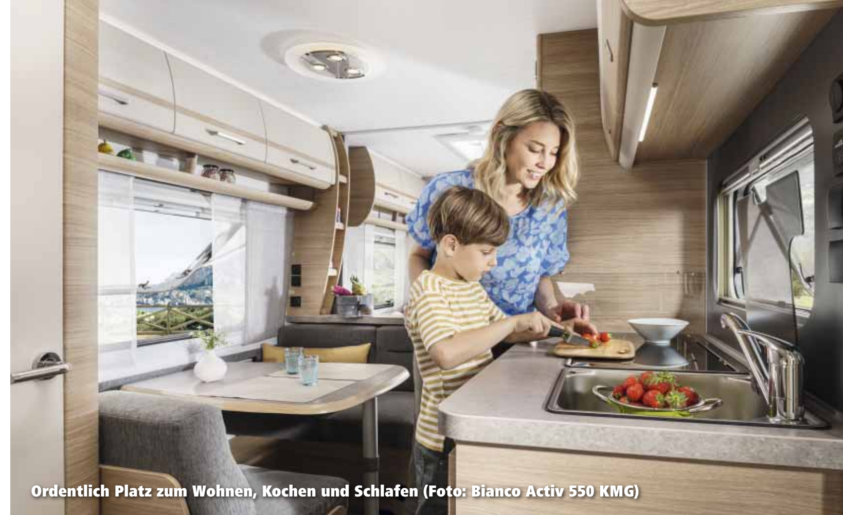
Ordentlich Platz zum Wohnen, Kochen und Schlafen (Foto: Bianco Activ 550 KMG)