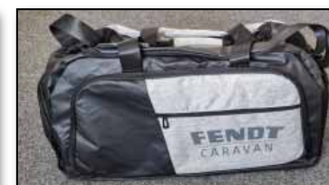
Sporttasche „BARRIE“, Artikel-Nr.: 2100, schwarz/grau, Material: Melange Polyester/600D, Polyester/210D (Innenfutter), Maße H/B/T ca. 34 x 60 x 27 cm, Volumen: ca. 55 Liter, mit 2-Wege Reißverschlusshauptfach, mit zwei Reißverschlussvortaschen und einem Reißverschluss- innenfach, seitliches Einsteckfach, verstellbares Schuhfach, abnehmbarer Schultergurt mit Pad-Trage- griffen, Euro 39,90