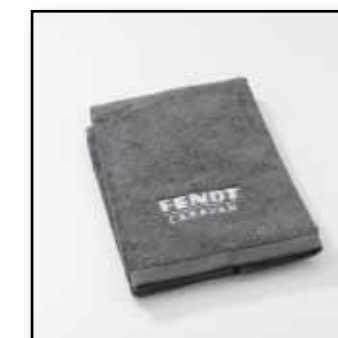
Walk-Frottier-Handtuch, von Erwin Müller, Artikel-Nr.: anthrazit: 9960 ; weiß: 9950, 50 x 100 cm, 100% Baumwolle, Euro 16,95