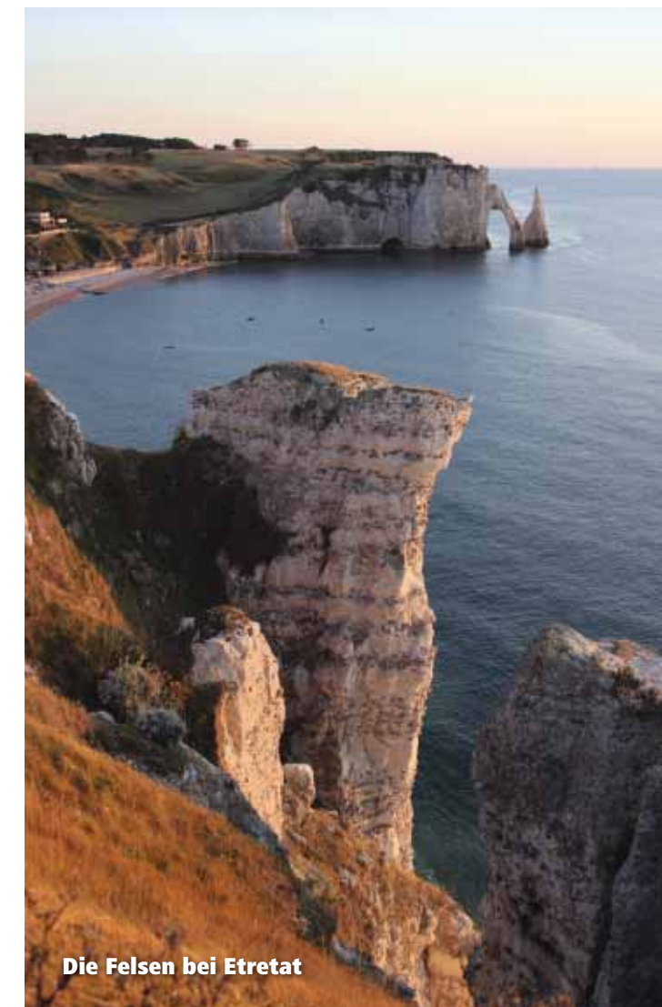
Die Felsen bei Etretat

Im Norden der Normandie trägt der Küstenabschnitt zwischen Le Havre und Le Tréport den wohlklingenden Namen Alabasterküste. Die alabasterfarbenen Kalksteinfelsen prägen das Landschaftsbild und diese herrliche Kulisse ist sicherlich ein Grund dafür, warum es die Urlauber in nette Orte wie Etretat, Fécamp, St-Valery-en-Caux oder Dieppe zieht. Reisende machen sich hier auf, um sich mit gepolstertem Strandlaken zum Strand aufzumachen, mit festem Schuhwerk an der Küste zu wandern oder abends eines der vielen guten Restaurants anzusteuern. Hervorzuheben ist Etretat mit seiner einzigartigen Felsformation und dem tollen Küstenwanderweg. Abends sitzt man hier oberhalb der Felsen und beobachtet wie die weißen Felsen bei Sonnenuntergang einen rötlichen Anstrich erhalten. Fantastisch!