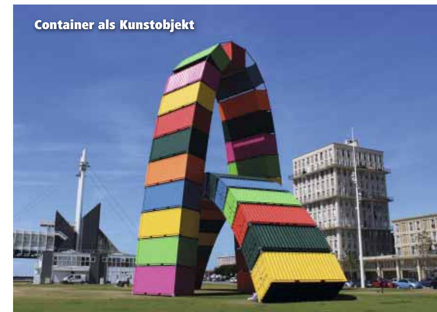
Container als Kunstobjekt

Zu einem der spannendsten Teile der Stadt gehört am Rande des Zentrums der „Quai de Southampton“. Hier türmen sich in Ufernähe bunte Container zu einem gewaltigen Kunstwerk auf. Geht man am Wasser in nördliche Richtung, so erreicht man nach wenigen Gehminuten den „Port de Plaisance“, einen riesigen Yachthafen mit rund 1.200 Liegeplätzen. Zwei große Molen schützen den Hafen vor dem offenen Atlantik. Vom Ende der Mole „Digue Nord“ hat man einen reizvollen Ausblick auf den Hafen und die ein- und auslaufenden Schiffe. Gleich nebenan kann man am schönen Strand sein Badelaken ausbreiten und sich erfrischen. Herrlich!