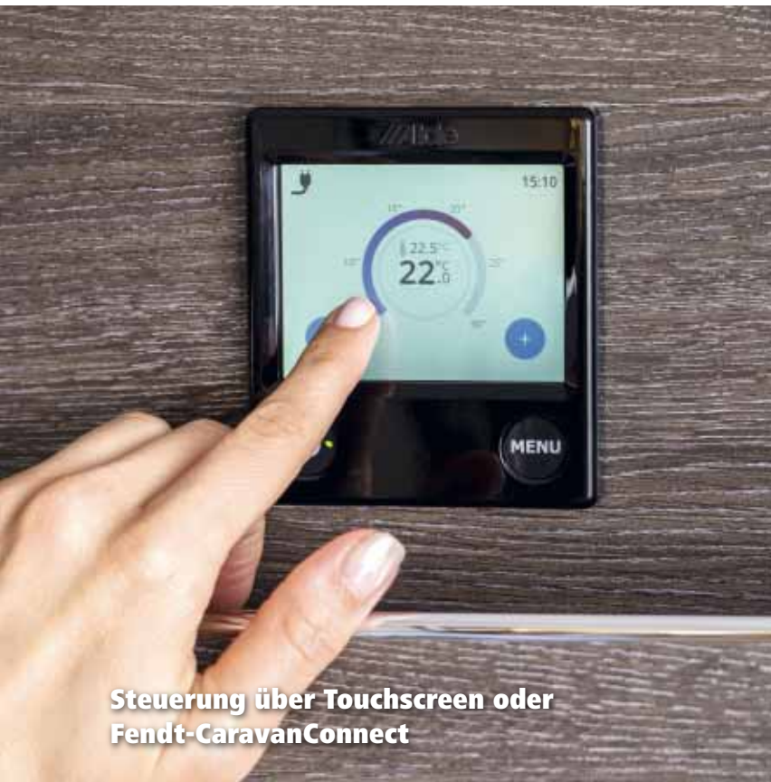
Steuerung über Touchscreen oder Fendt-CaravanConnect