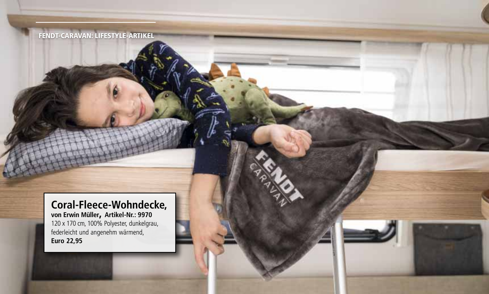
Coral-Fleece-Wohndecke, von Erwin Müller, Artikel-Nr.: 9970 120 x 170 cm, 100% Polyester, dunkelgrau, federleicht und angenehm wärmend, Euro 22,95